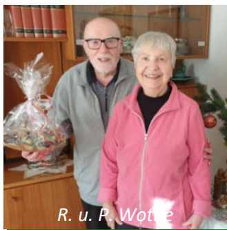
R. u. P. Wotje