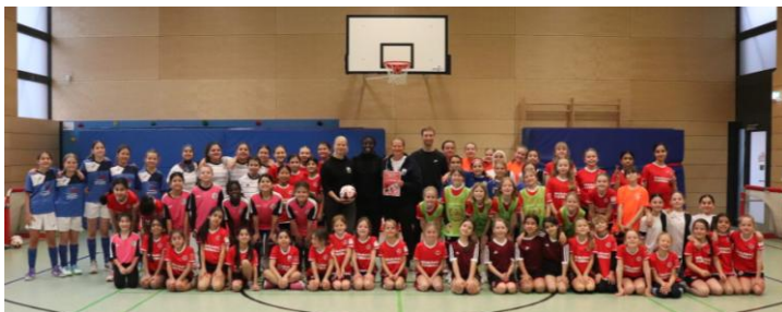
Bildunterschrift: Am 5. Dezember 2025 wurde die neue Strategie während eines Turniers des BFV-Mädchenfußballprojekts „Alle kicken mit“ präsentiert.

Die komplette Strategie kann unter folgendem Link nachgelesen werden: https://t.ly/40ZcW